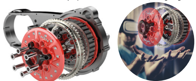
Modelo cedido pela BAKER Drivetrain